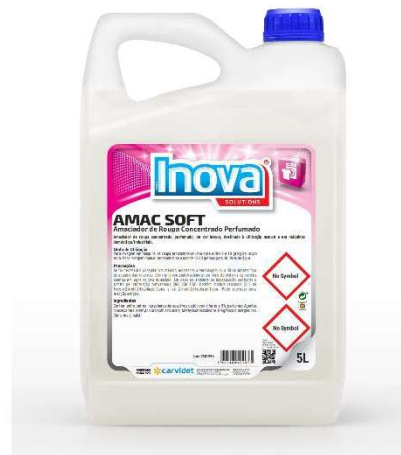
IMAGEM DE PRODUTO

Lavagem manual: Recomenda-se o uso de 15-30 gramas para 10 litros de água.