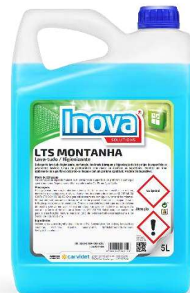
IMAGEM DE PRODUTO