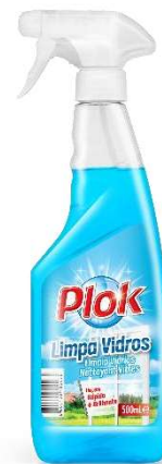
IMAGEM DE PRODUTO